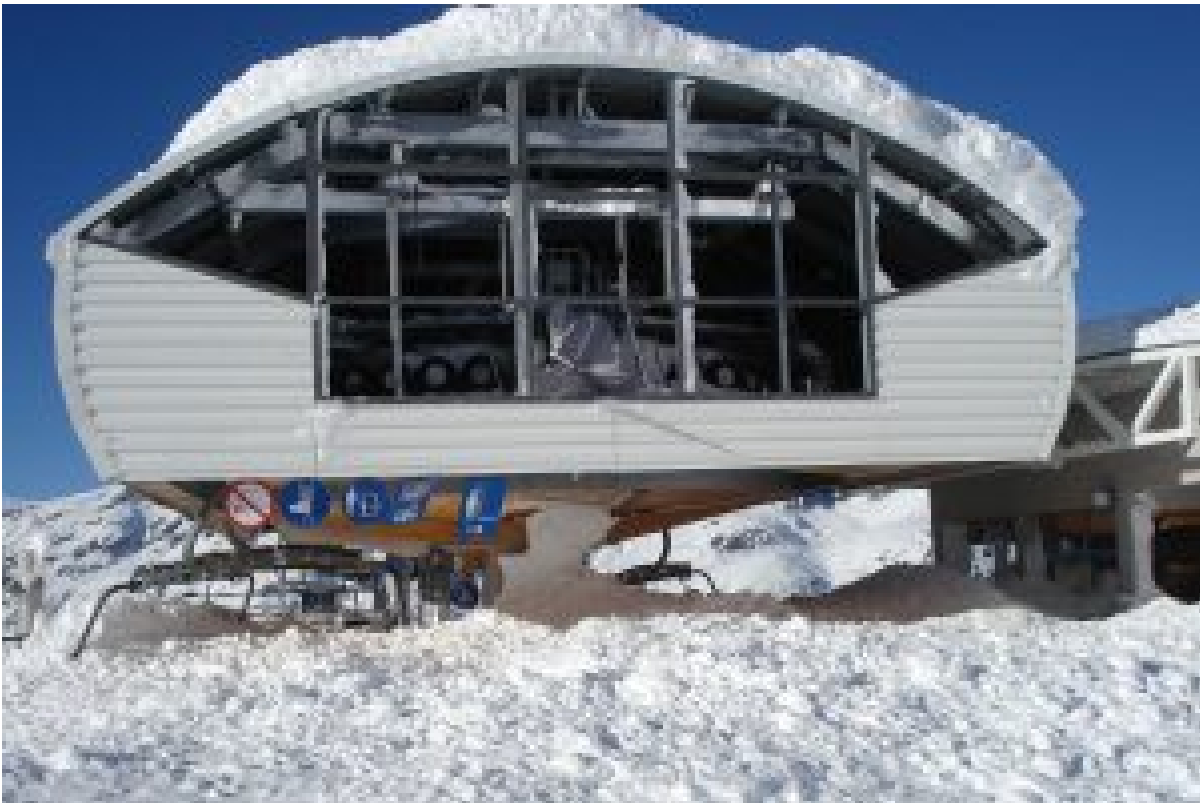
Figure 4 : dommage à la gare (endommagement des surfaces en plexiglas du tympan).