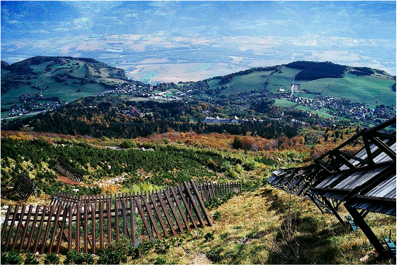
Photographie 2. Les établissements hospitaliers de Saint-Hilaire-du-Touvet en octobre 1998 vus depuis les râteliers.