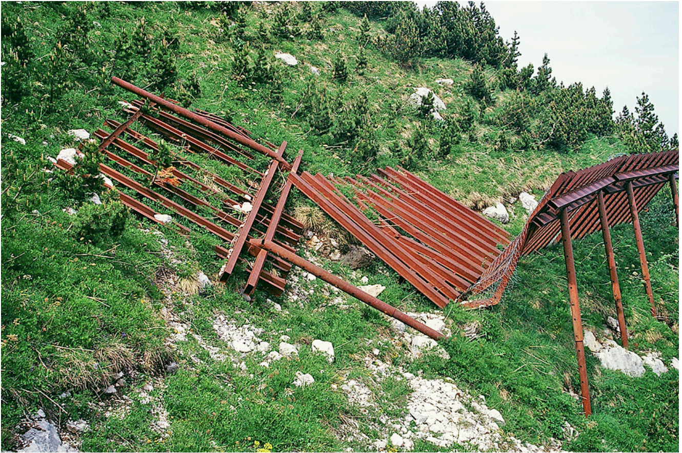
Photographie 6. Râteliers dégradés et laissés sans entretien (octobre 1998).