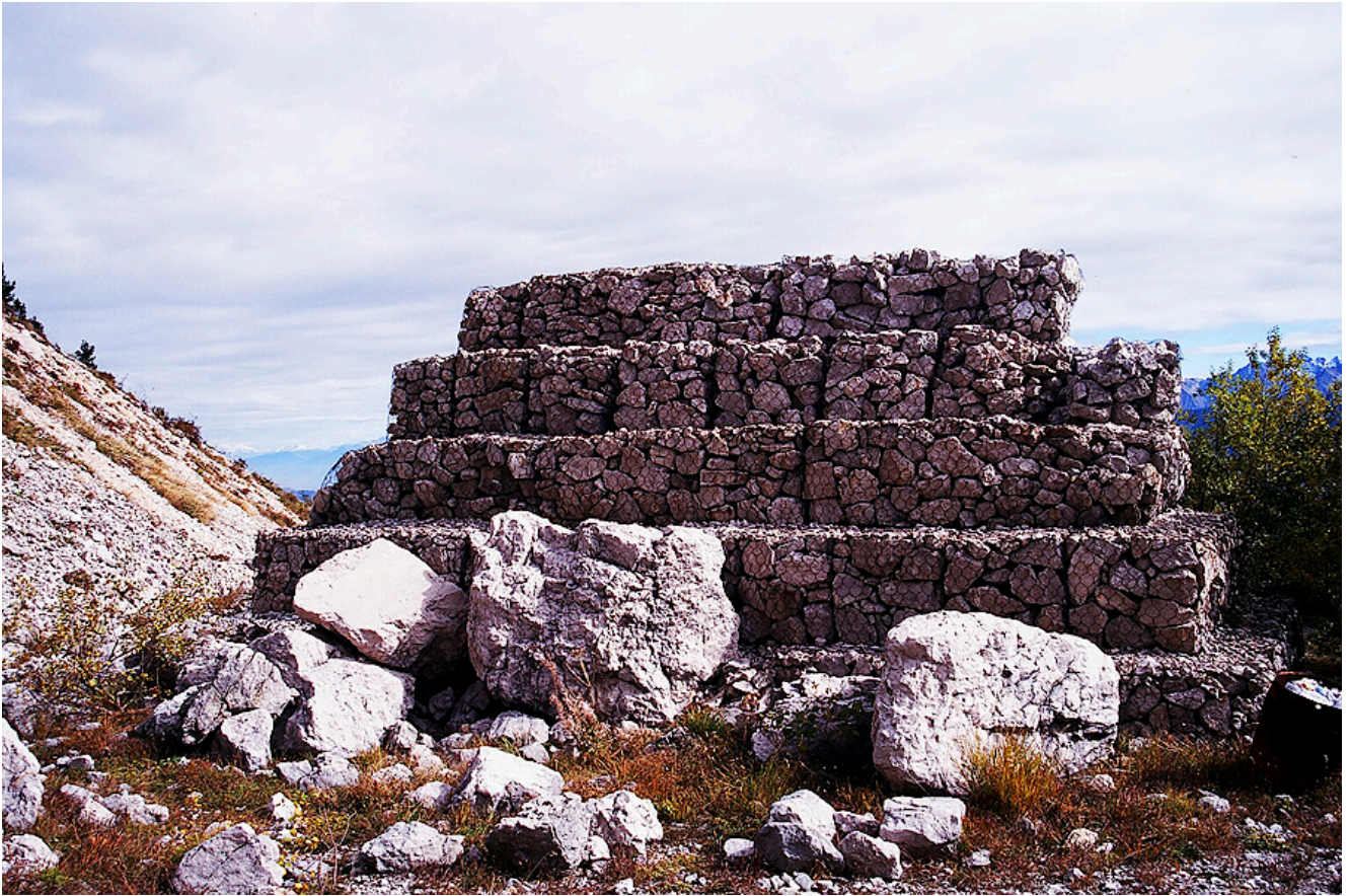
Photographie 5. Étrave en gabions sous les Rochers du Midi en octobre 1998.