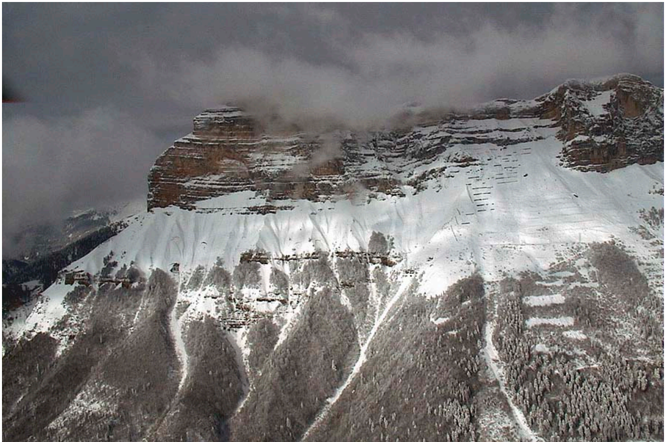
Photographie 4. La Dent de Crolles au-dessus de Saint-Hilaire-du-Touvet et les zones de départ d'avalanches le 8 février 1999.