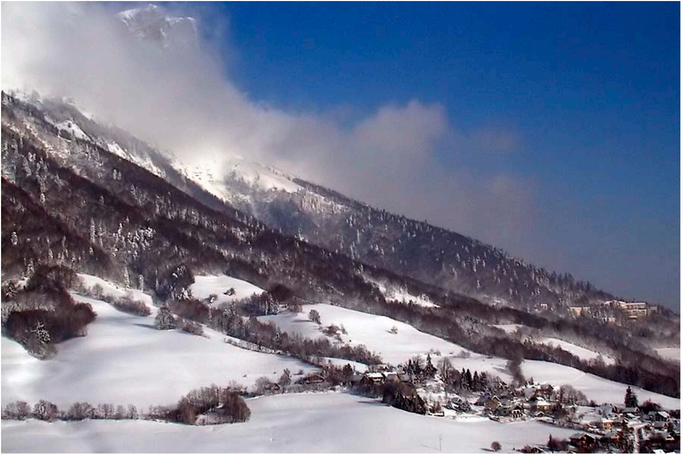
Photographie 3. Le plateau de Saint-Hilaire-du-Touvet en février 1999.