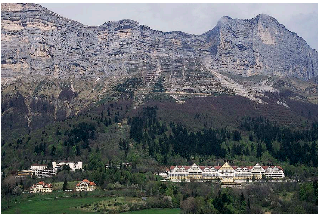
Photographie 1. Les établissements hospitaliers de Saint-Hilaire-du-Touvet en octobre 1998.

J'ai eu la désagréable surprise de voir mon étude citée comme étant l'élément détonateur de la décision de fermeture des établissements de Saint-Hilaire-du-Touvet. Je donne ici mon point de vue d'acteur sur ce que je considère être un fiasco en termes d'aménagement du territoire. L'article ne se prétend pas être impartial. Il ne donne pas une vue complète de la problématique. Je ne fais que témoigner de ce dont j'ai eu connaissance au cours de mon travail (1998-2001) et de ce qui s'est passé en parallèle.