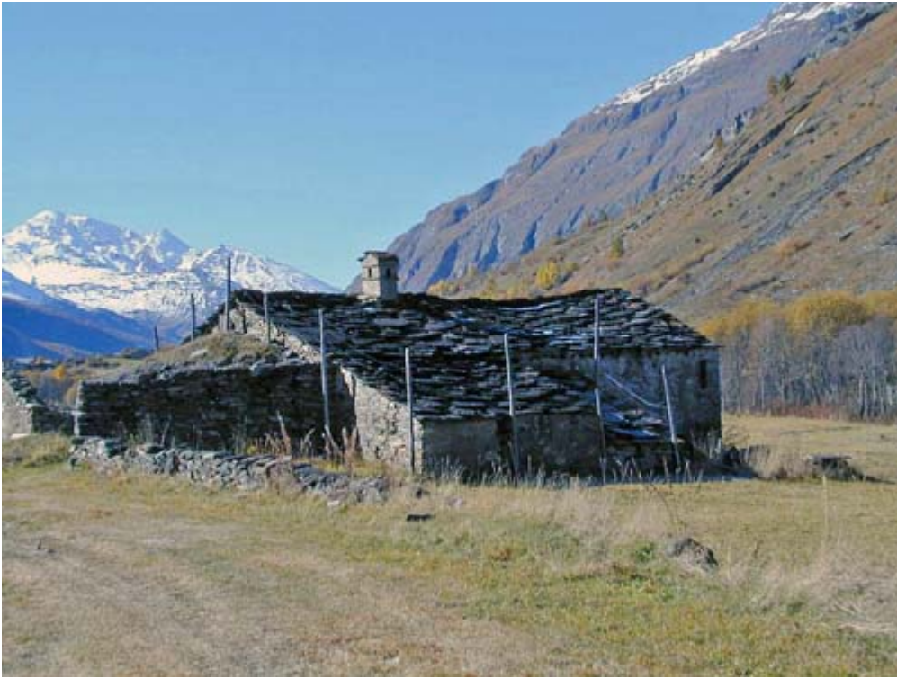
Etrave protégeant une bergerie (Bessans, Savoie).