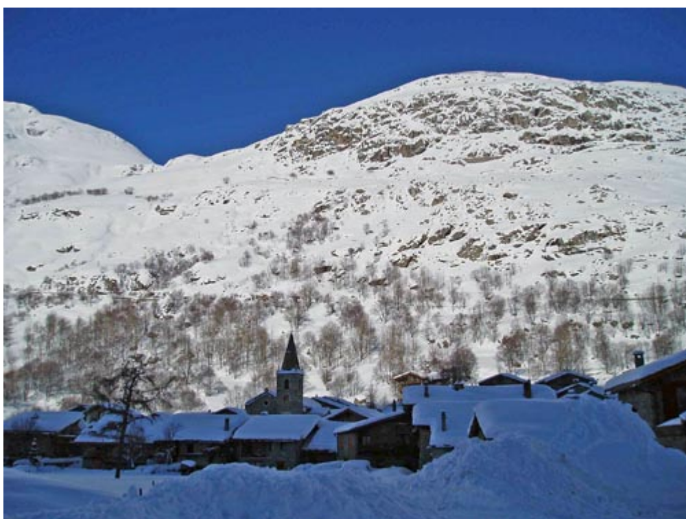
Les pentes de la Grande Feiche à Bonneval-sur-Arc (Savoie).

départ de nouvelles avalanches. Il existe également quelques cas où les techniques de protection ne furent pas mises en œuvre par les habitants eux-mêmes, mais par les autorités. La mise en ban des forêts dans le royaume de Piémont-Sardaigne est un exemple de première législation à vocation de lutte contre les avalanches. Barèges (Hautes-Pyrénées) fut le premier site en France à bénéficier d'une défense active contre les avalanches. Reflétant de façon fidèle l'état d'esprit qui a prévalu en Europe jusqu'aux lendemains de la seconde guerre mondiale, l'ingénieur Lomet concluait au terme d'un voyage à Barèges en 1794 que c'était le déboisement qui est à l'origine des avalanches catastrophiques sur Barèges. La solution ne pouvait donc passer que par la reforestation des pentes. La présence d'un hôpital militaire dans une zone exposée a entraîné les premières études de protection par le Génie militaire dès 1839, mais il fallut attendre l'avalanche catastrophique de 1860 pour voir les premiers travaux.